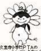
久宝寺小学校PTAのシンボル久ちゅん

学校・家庭・地域がしっかりと手を取り合い、将来の担い手である子どもたちが、安心して成長できる環境づくりを一緒にしていきたいです。