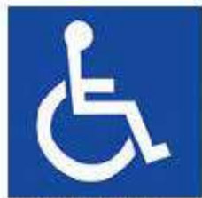
障がい者のための 国際シンボルマーク