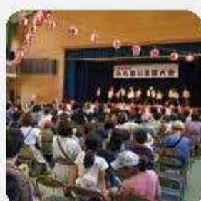
好きやねん「ふれあい演芸会」