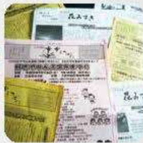
地域情報誌の発行

「総務」という名にふさわしく、その活動は多岐にわたりますが、見方を変えると、諸活動を通じて「学習」「情報共有」「話し合い」の「場づくり」をさせていただいていると言えます。これら「場づくり」という視点で各活動を位置づけ、関係団体や部会との連携を始め、広く住民の皆さんに参画いただけるよう活動を展開しています。