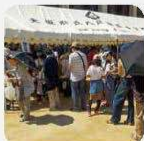
好きやねん「野外コーナー」