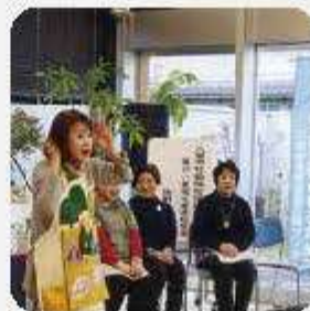
障がい者を囲むふれあい祭り