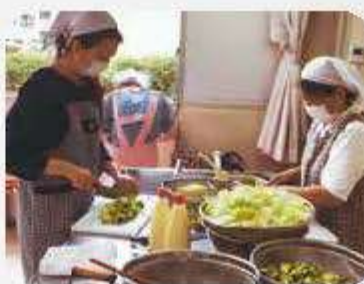
「ひまわりの会」を支援