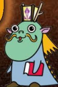
燈路まつりマスコットキャラクター 「久麟(きゅーりん)」

久宝寺寺内町の内外に生まれ育った子どもたちの故郷意識を育み、住民たちの絆をより強く導き、500年以上の歴史を継承し、活発にしていくことが目的です。近年はSNSによる発信で、全国の人たちに歴史ある久宝寺寺内町の魅力を伝えています。