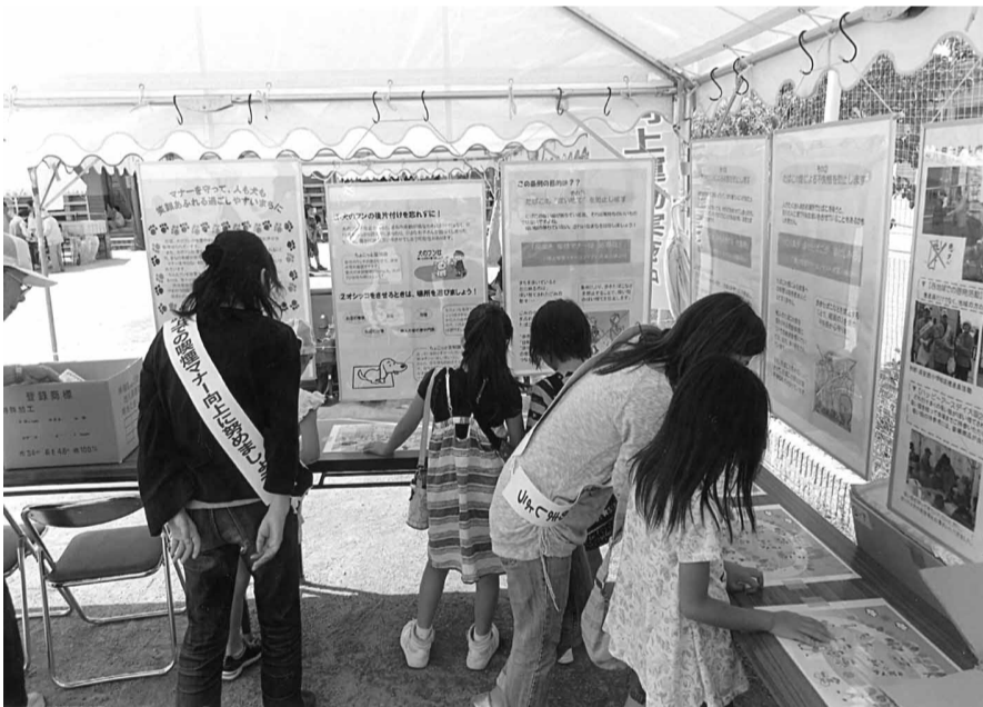
「好きやねん久宝寺まつり」での啓発ブースの様子