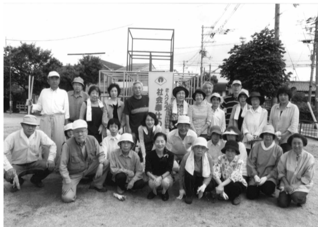
「社会奉仕日」の清掃活動に参加のみなさん

地域住民の高齢化が進み、体力的な問題で清掃活動・パトロール活動も容易ではないとの声が増え、住民皆様のさらなるご支援ご協力が求められます。