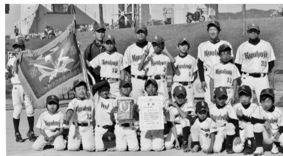
H27.10.25 第14回大阪知事杯優勝

① 男子・久宝寺ソフトボールクラブ ・八尾こども会連合春季大会…優勝 ・大阪府知事杯(秋)…優勝