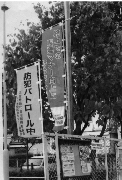
東久宝寺一丁目公園の啓発のぼり

地道で息の長い取り組みになりますが、地域の皆様のご理解とご協力をよろしく願います。