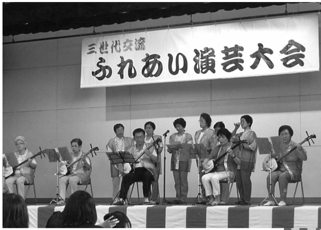
日頃の練習の成果を披露していただきました

この「おまつり」が、いつまでも皆さんの楽しい思い出となるように、これからも続けていきます。そのためにも、皆さんのご協力、ご支援をよろしくお願い致します。