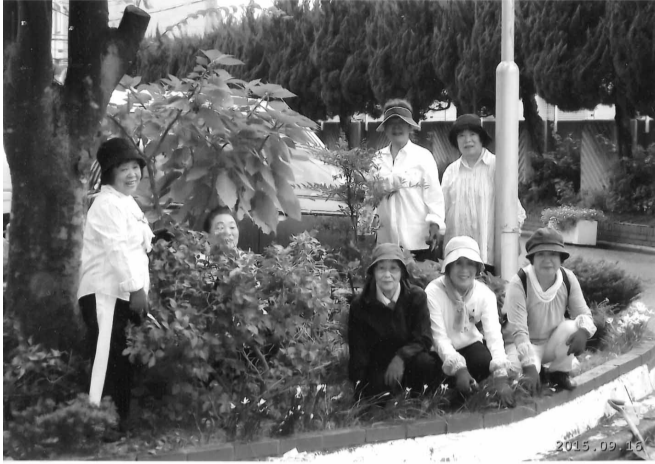
美化活動のみなさん