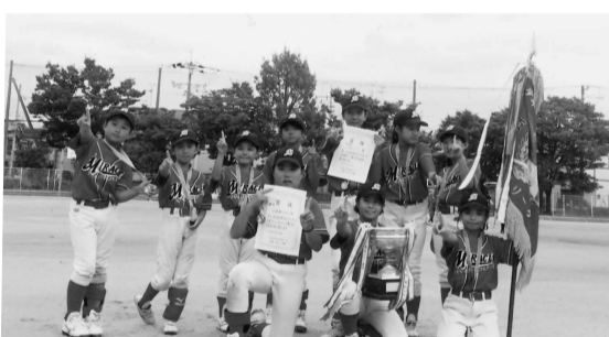
H27.9.22 八尾リーグチャンピオンシップ優勝

① 女子・久宝寺ミラクル ・八尾新人戦…優勝 ・八尾こども会連合夏季大会…準優勝 ・八尾リーグチャンピオンシップ…優勝