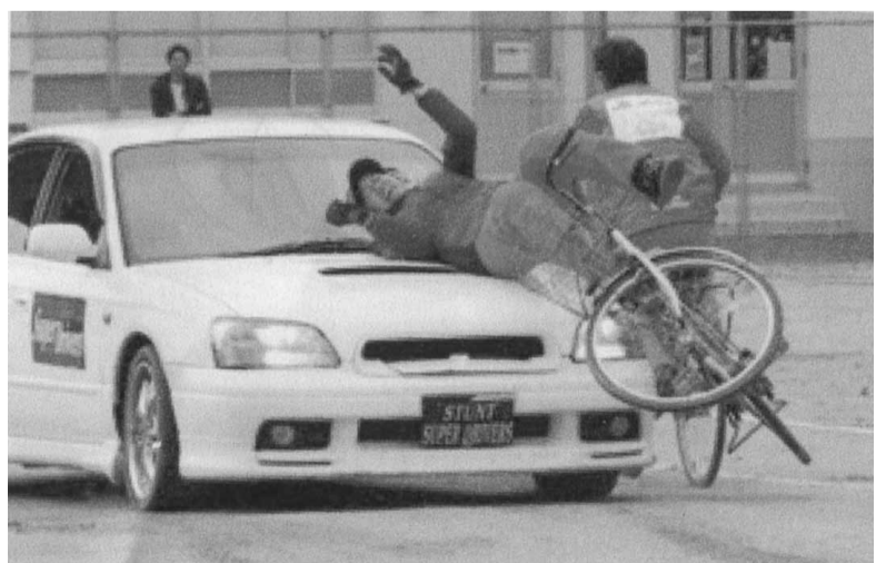
スタントマンによる、自転車と自動車の衝突実演

雨の中、全校生徒と福祉委員会などの地域住民も参加して、スタントマンによる、自転車の危険行動と事故の迫真の模擬演技を見せて